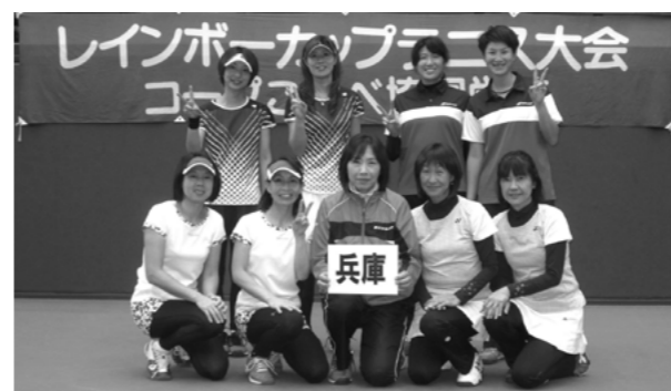
昨年度の団体優勝チーム〔兵庫県〕の皆さん