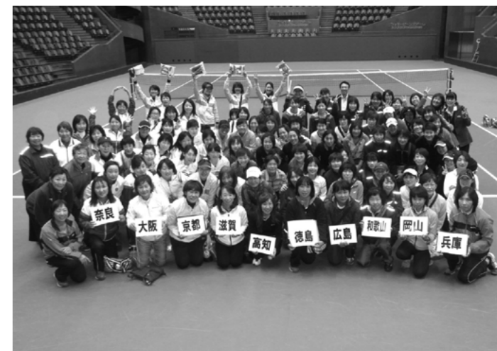
昨年度決勝大会参加の皆さん